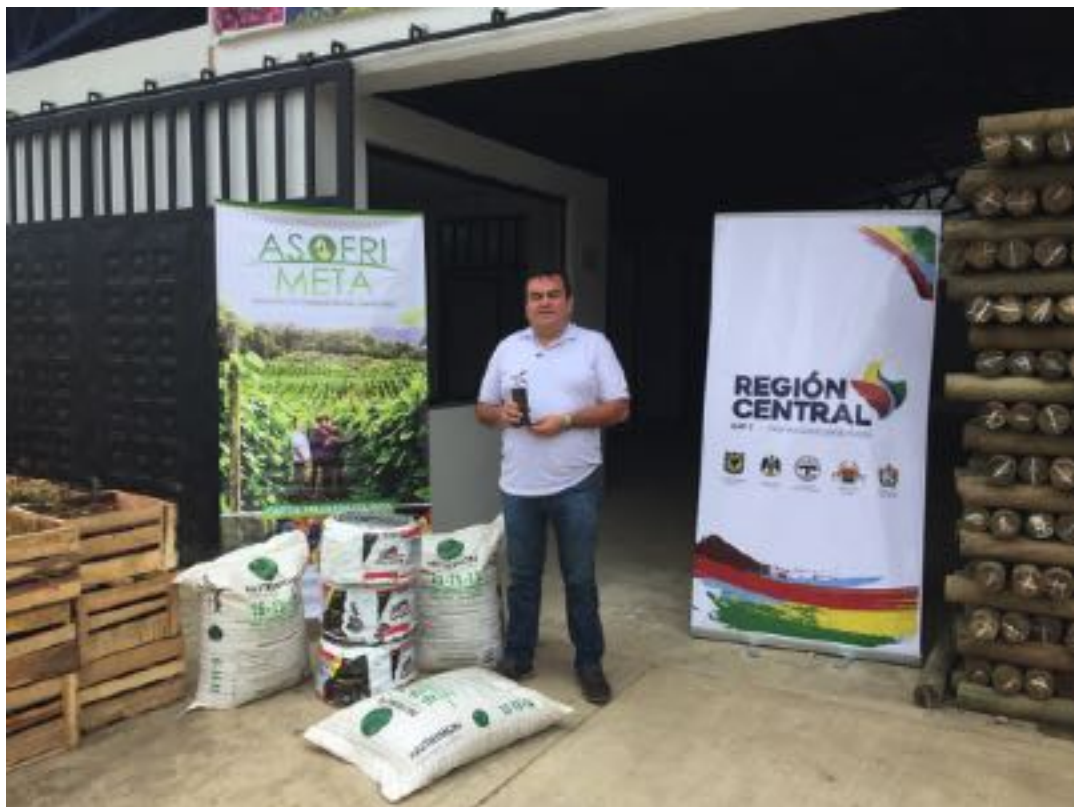
Beneficiario de San Juanito, Meta. Diciembre 2018.