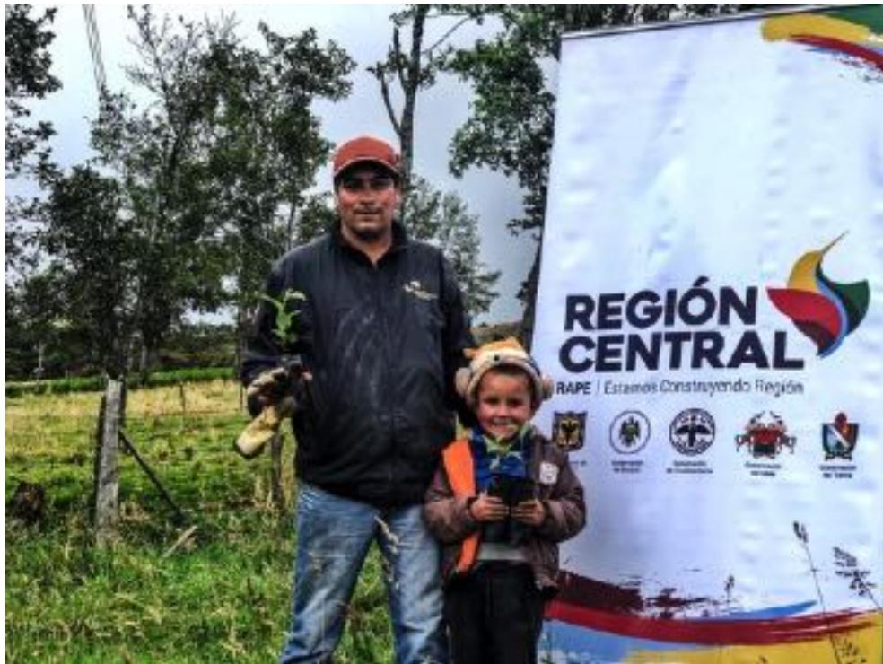
Beneficiario de Ráquira, Boyacá. Diciembre 2019.