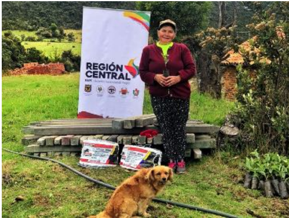
Beneficiaria de Ráquira, Boyacá. Diciembre 2019.