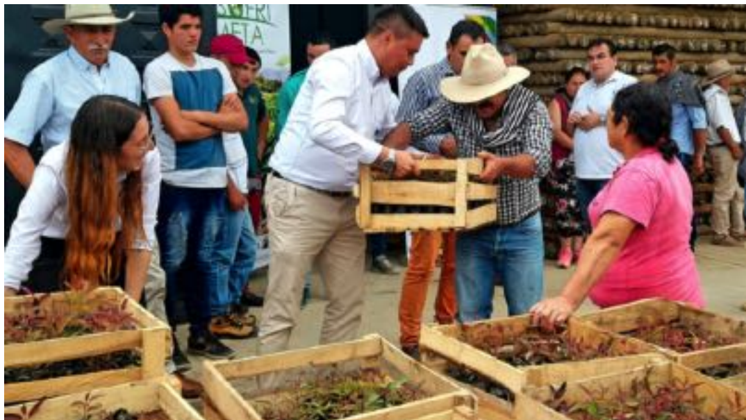
Beneficiarios de San Juanito, Meta. Diciembre 2018.