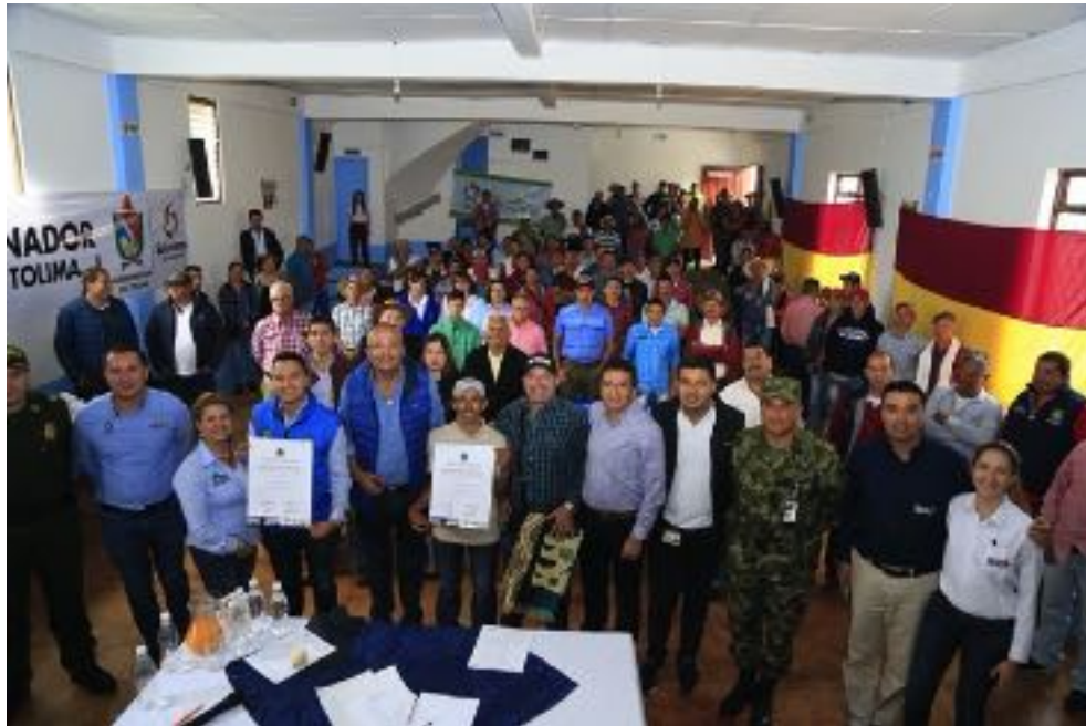
Beneficiarios Herveo, Tolima. Noviembre 2019.