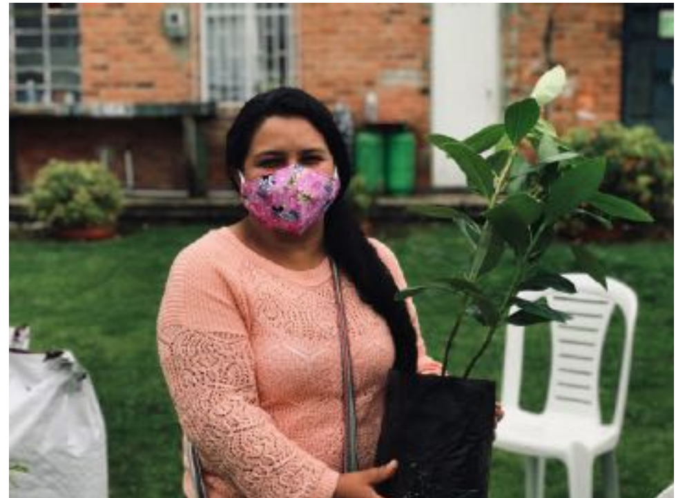
Beneficiaria de Cogua, Cundinamarca. Junio 2020.

Según Decreto Ley 870 de 2017. Presidencia de la República.