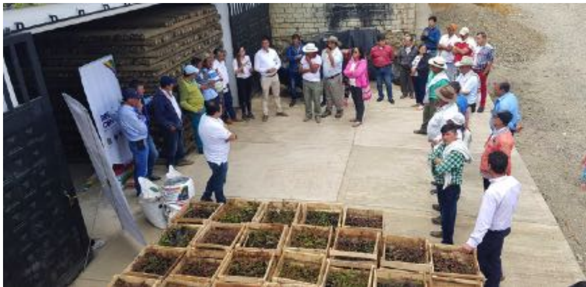
Beneficiarios de San Juanito, Meta. Diciembre 2019.